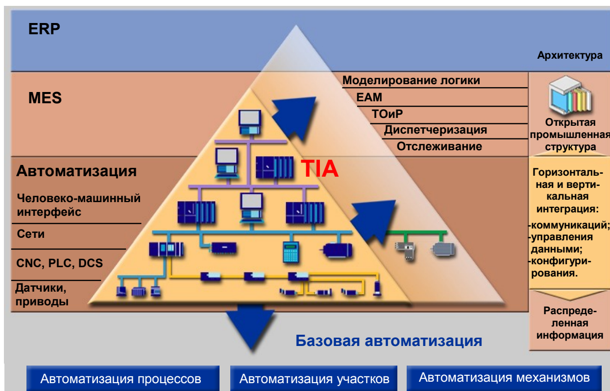
Рисунок 1 Комплексная автоматизация